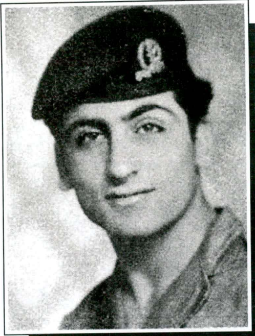
סמל נפשי רמי ז"ל בן 25 בנפלו