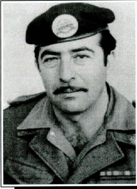
סגן זנד ישראל ז"ל בן 35 בנפלו