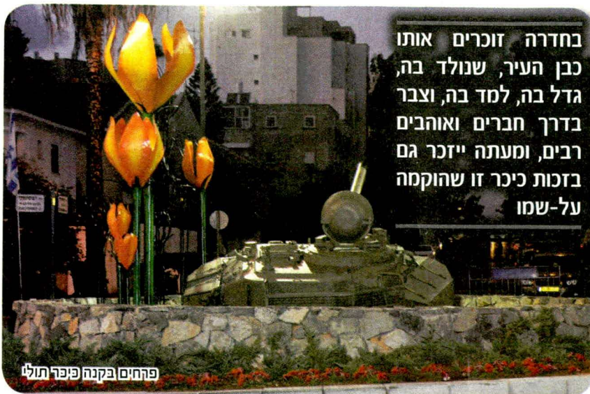
פרחים בקנה פיפר תול

נחנכה כיכר על שם רב-סרן תובל גבירצמן תושב העיר