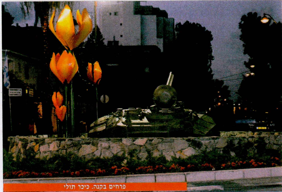
פרחים בקנה. כיכר תולי

בחדרה זוכרים אותו כבן העיר, שנולד בה, גדל בה, למד בה,