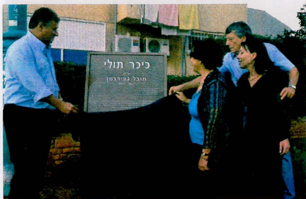
הסרת הלוט מלוחית הזיכרון

רס"ן גבירצמן נפל במבואות ביירות במלחמת שלום הגליל כאשר ניסה לחלץ חיילים פצועים מנגמ"ש בוער. כאשר היה ילד נכתב עליו שיר הילדים הידוע "תולי"