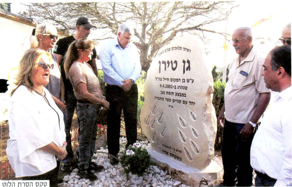
טקס הסרת הלוט