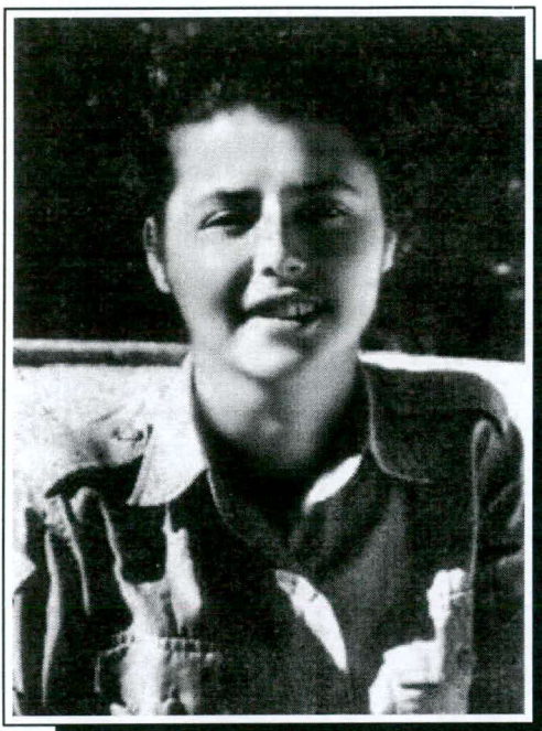
טר"ש אבני שרונה ז"ל בת 22 בנפלה